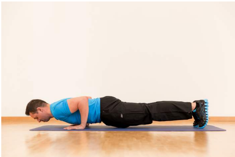
3|12 Wer noch nicht genug hat, baut beim Ausatmen Liegestützen ein. Die Übung stärkt Rumpf, Arme und Beine. Sixpack, wir kommen!