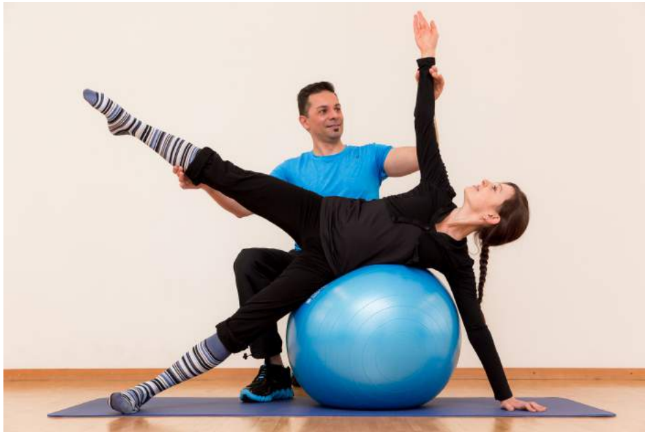
12|12Side Bend geht auch auf dem Swiss Ball. Zum Schluss hofft unsere Redaktorin auch auf mehr Muckis und guten Sex.