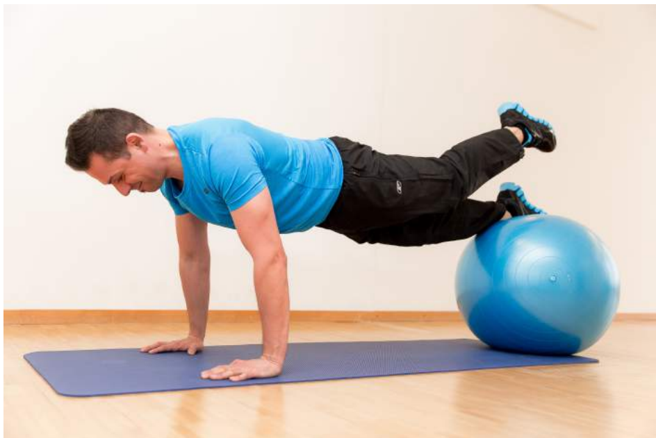
7|12 Wer seine Balance noch mehr herausfordern will, der hebe ein Bein, dann das andere. Wichtig: in der Anstrengung ausatmen, die Wirbelsäule lang machen und den Nacken nicht verkrampfen.