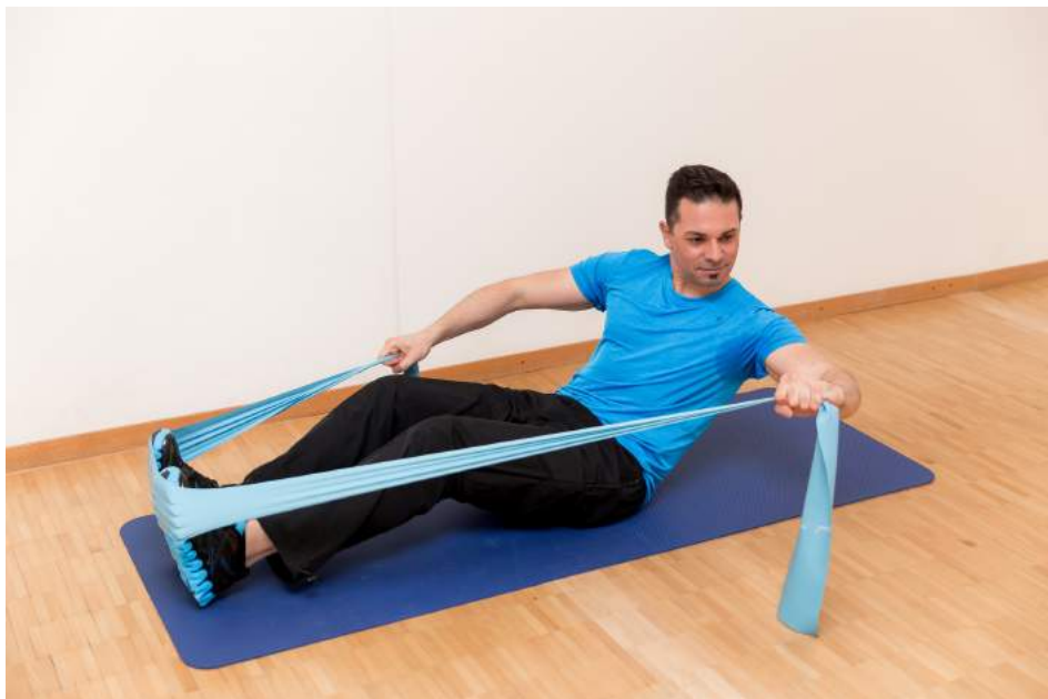
9|12 Mit dem Ausatmen Arm ausstrecken für Schultermuskulatur und Trizeps. Wer kein Theraband zur Hand hat: Petflaschen oder Tetrapack sind willkommene Trainingshelfer.