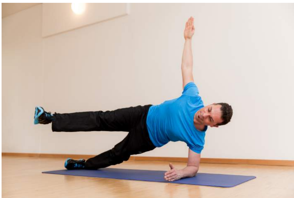
11|12 Wer noch mehr davon will: Side Bend mit gestreckten Beinen bringt die Muskeln richtig zum Brennen.