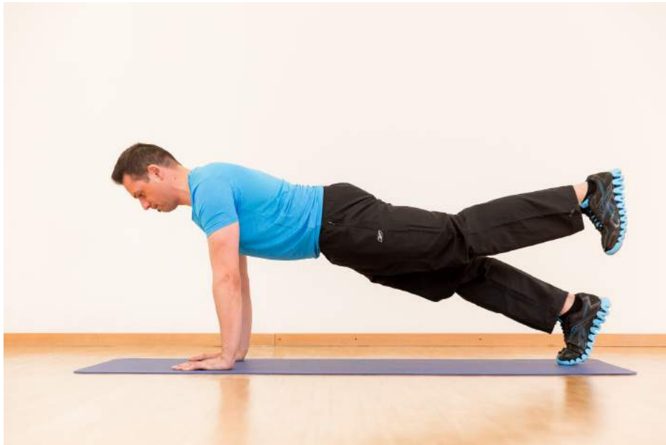
2|12 Leg pull front , eine Übung für Bauchmuskeln und Stützkraft. Beim Ausatmen ein Bein heben, bis maximal Beckenhöhe. 6- bis 8-mal wiederholen.