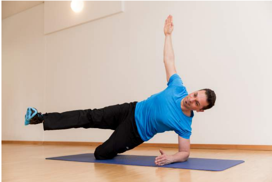
10|12 Side Bend mit Kick Front kräftigt seitliche Bauch- und Schultermuskeln. Für ein 3-D-Sixpack: Beim Ausatmen Bein nach vorne bringen. Die Bewegung kommt aus der Hüfte, nicht aus dem Rücken