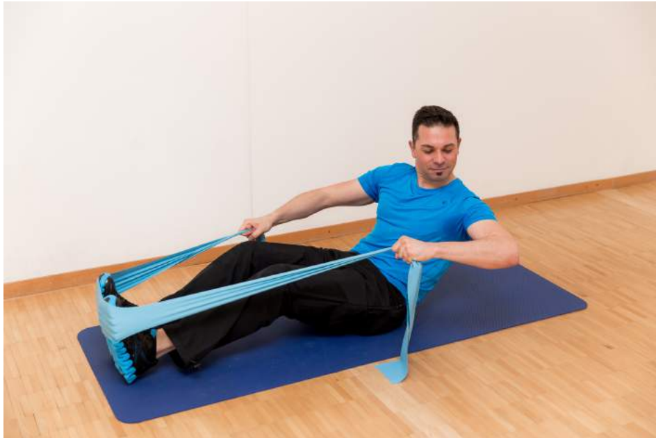
8|12 Rowing seitlich mit dem Theraband macht Rundern noch mehr Spass. Beim Ausatmen Ellbogen nach aussen ziehen. Den Körper mitdrehen, das fordert die schräge Bauchmuskulatur.