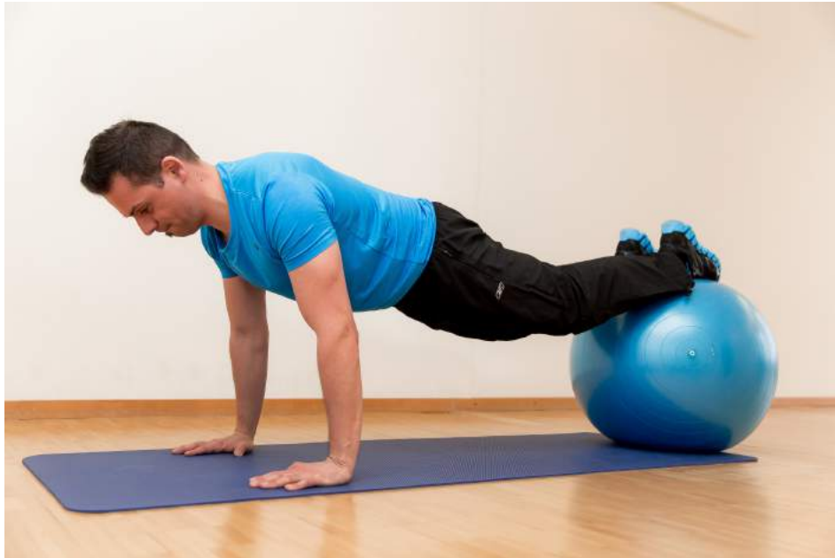
4|12 Core Control mit Swiss Ball Diese Plankposition aktiviert die Tiefenmuskulatur garantiert. Wichtig: Hände sind unterhalb der Schulter. Wer keinen Ball hat, kann die Übung mit einem Bürostuhl probieren.